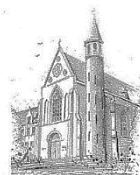
Parochie O.L.V. Onbevleekt Ontvangen Zenderen

Zoals u heeft kunnen zien, zijn de restauratiewerkzaamheden aan de kerk gestart. Twee aannemers uit Zenderen en één aannemer buiten Zenderen zijn betrokken. Het gaat om diverse werkzaamheden en schilderwerkzaamheden aan de buitenkant van de kerk, de vloer van de Sacristie en de restauratie van een gescheurde balk in de Toren van de kerk. De komende maanden worden de werkzaamheden uitgevoerd.